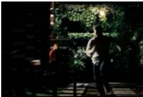
Kapitel 17: „Streit mit Karo“ (01:21:51)

a) Schaut euch die beiden Szenen bis zu den folgenden beiden Bildern an