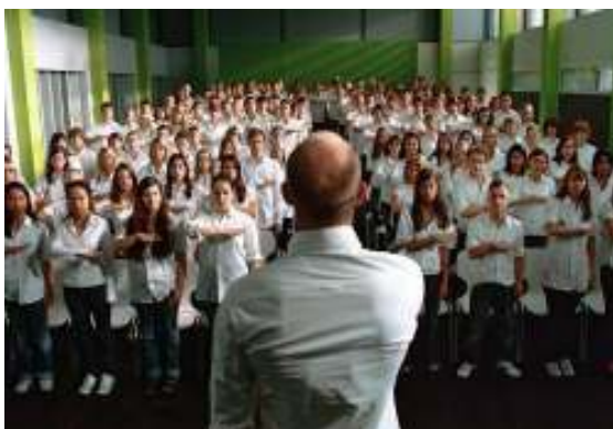
DIE WELLE, Kapitel 18: „Es ist vorbei“

Welche Gemeinsamkeiten und welche Unterschiede kannst du feststellen?