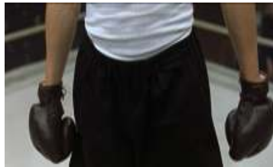
Kapitel 20: „Verlorener Kampf“ (01:39:08)