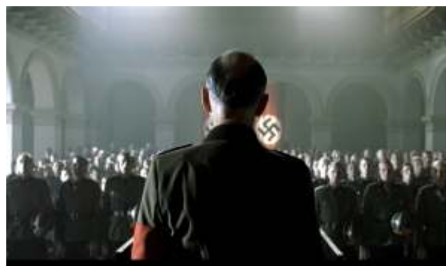
NAPOLA, Kapitel 5: „Begrüßungsrede“

http://www.youtube.com/watch?v=xpGJSTOWiUo&feature=related